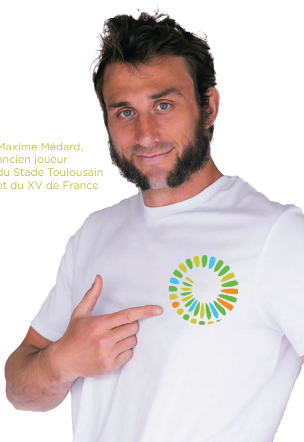
Maxime Médard, ancien joueur du Stade Toulousain et du XV de France

« Au rugby comme dans ma vie, j'ai toujours eu à cœur de me dépasser et de me lancer dans de nouvelles aventures collectives pour faire avancer des projets, faire grandir des équipes ou transmettre. En tant que parrain de l'Oncopole , mon rôle est de soutenir les actions et les équipes de l'Oncopole mais aussi d'encourager mes proches et mon entourage à se mobiliser pour faire avancer la lutte contre le cancer.