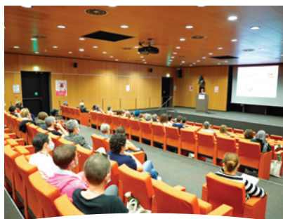
Le Pr Florence Dalenc a lancé les conférences de l'après-midi