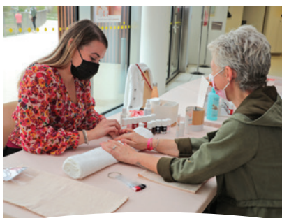
... mais aussi maquillage, soins bien-être