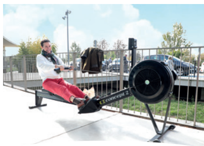
Plus de 150 patientes ont pu participer aux 12 ateliers découverte : escrime, aviron, rugby santé...